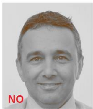
Bianco e Nero