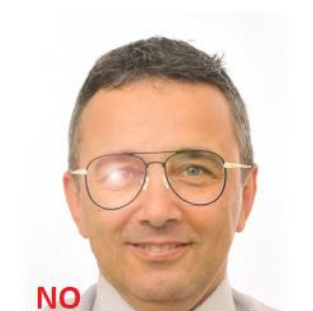
Riflesso su occhiali vista

DIRITTI DI UTILIZZO: Il presente documento appartiene alla ASSOCIAZIONE NAZIONALE UFFICIALI DELLE FORZE ARMATE e contiene informazioni ed immagini di carattere riservato, privato e confidenziali rivolte esclusivamente ai soci UFAIT. È vietato l'uso, la diffusione, distribuzione o riproduzione da parte di ogni altra persona. Nel caso aveste ricevuto questo documento per errore, siete pregati di segnalarlo immediatamente al mittente e distruggere quanto ricevuto senza farne copia. Qualsiasi utilizzo non autorizzato del contenuto del presente documento costituisce violazione dell'obbligo di non prendere cognizione della corrispondenza tra altri soggetti, salvo più grave illecito, ed espone il responsabile alle relative conseguenze.