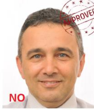
timbri e spillature